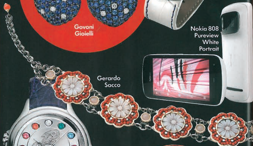
Fendi Crazy Carats